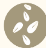
Grãos de sésamo