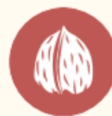
Frutos de casca